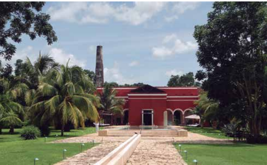
HACIENDA TEMOZÓN, A 46KM DEL CENTRO DE MÉRIDA

Vale la pena visitar la Plaza Grande de noche, para tomar un descanso en estas sillas, y aprovechar a comer una típica marquesita de queso de bola con cajeta o crema de avellana ¡Qué delicia! ☺