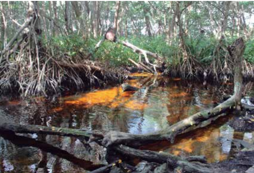
MANGLARES DE SAN CRISANTO, A 77KM DEL CENTRO DE MÉRIDA

Por la tarde, una nieve típica de guayaba, nance o chirimoya, resulta una delicia por el clima caluroso. Los Helados Colón son las nieves típicas del lugar, y hay un local en el Paseo Montejo. Con nieve en mano, caminar a lo largo del tan popular paseo es un viaje al pasado de la ciudad, mientras se admiran sus antiguas mansiones, muchas de ellas convertidas en museos hoy en día.